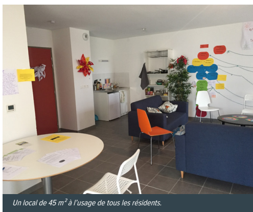
Un local de 45 m 2 à l'usage de tous les résidents.