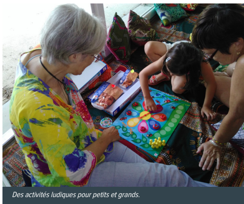
Des activités ludiques pour petits et grands.

Activités ludiques, soutien à la parentalité, stages de théâtre et de contes : les animations mobilisent les habitants et la Mairie de Gaillac, qui participe activement au suivi du projet.